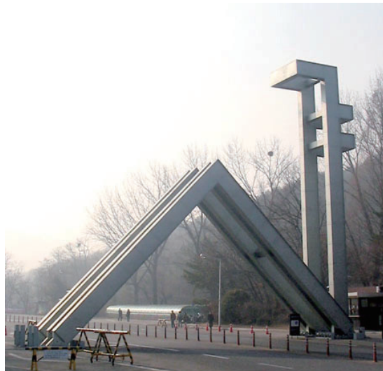
Seoul National University